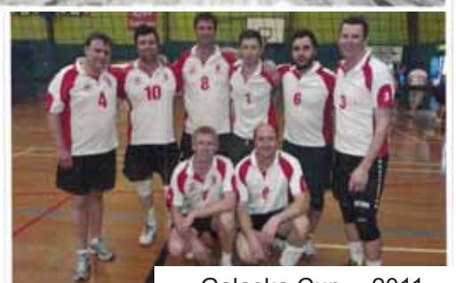
Galaska Cup 2011