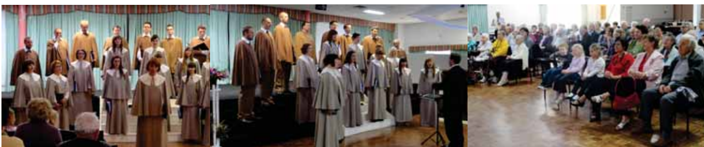
Chór Katolickiego Uniwersytetu Lubelskiego „KUL”