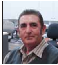
ENTERTAINMENT FUNCTIONS Bronisław Siwicki